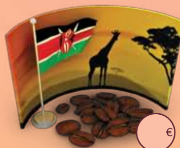
Café espresso Kenia AAA

Café muy aromático. Notable acidez natural. Ciertas notas a cítricos y frutos rojos.