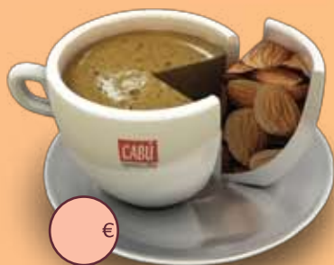
Café espresso Guatemala Antigua

Gran café de alta calidad. Sabor completo y redondo en boca.