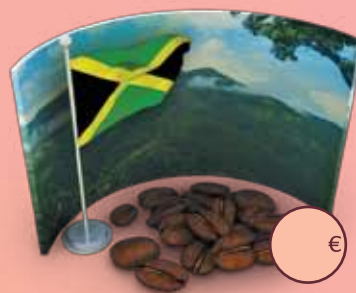
Café espresso Jamaica Blue Mountain

El más cotizado y famoso. Suave y perfumado. Ligeros toques achocolados y afrutados.