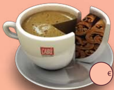
Café sabor Canela