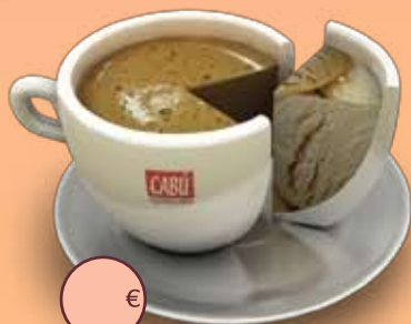
Café espresso Colombia Supremo Popayán

Café corposo. Suave y fina acidez. Con gustos y sabores afrutados.