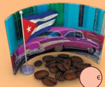
Café espresso Cuba Extra Turquino

Cuerpo ligero . Aromas y sabores almendrados.